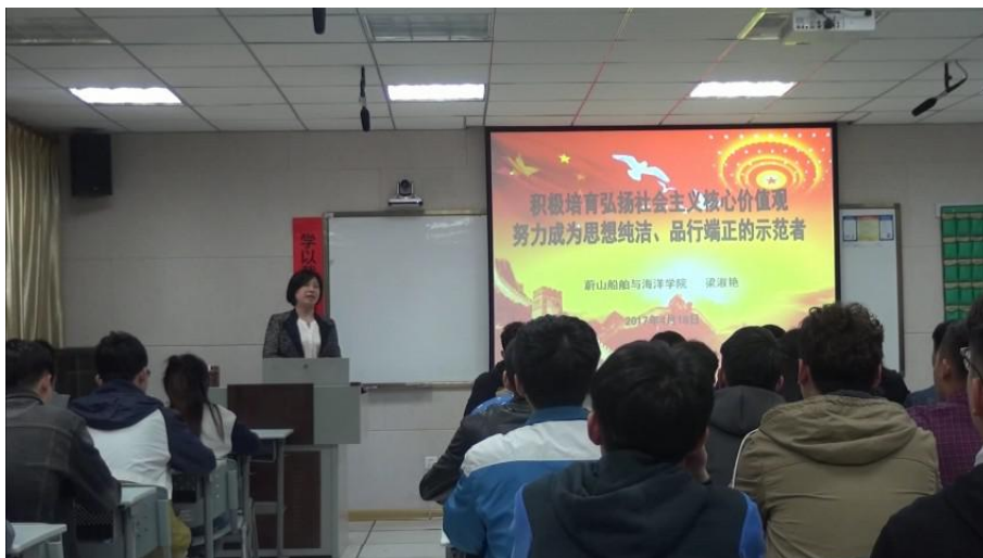
山船舶与海洋学院举办主题党日