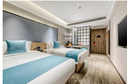
悦为智酒店（保定东站店）双床房