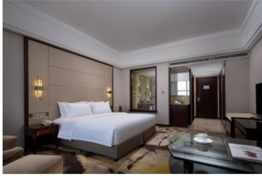
卓正国际酒店大床房