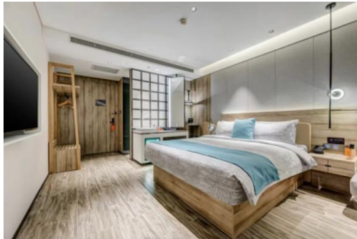
悦为智酒店（保定东站店）大床房