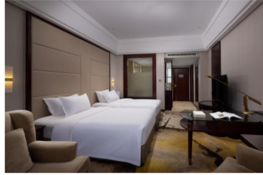
卓正国际酒店双床房